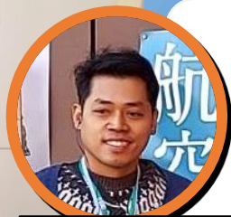
ジュンさん (フィリピン)

The beds on the submarine are narrow and uncomfortable. I thought it would be impossible for me to live and work in this place.