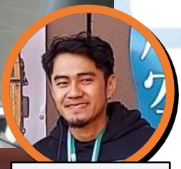
ルウさん (フィリピン)

When I looked through the submarine's periscope, I was surprised to see the island on the other side of the ocean so close.